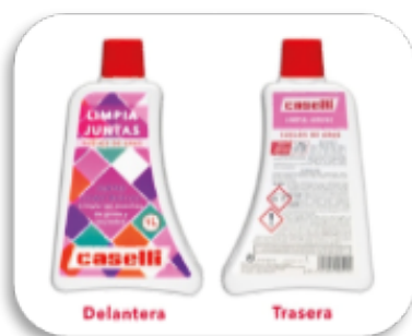
Producto de limpieza con etiquetas delantera y trasera.

*Productos químicos. Son sustancias con las que se fabrican los productos de limpieza, especialmente los desinfectantes.