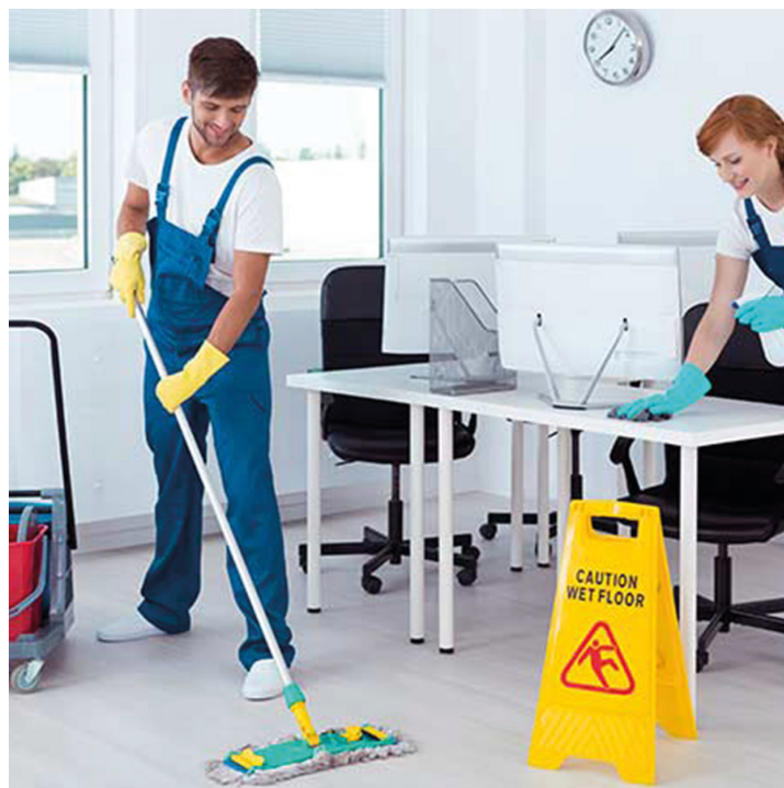
Personas limpiando con indicador de suelo mojado.

También se puede incluir cualquier problema que hayamos tenido a la hora de realizar nuestro trabajo o lo que no hayamos terminado en nuestro horario.