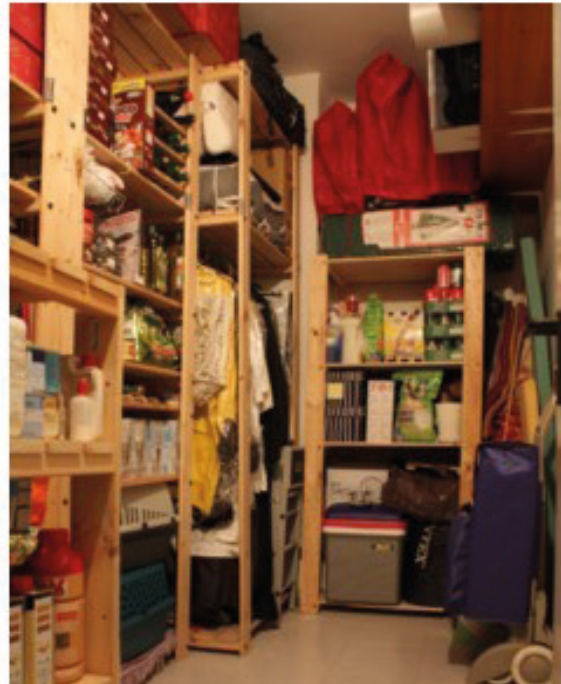
Cuarto de limpieza ordenado.