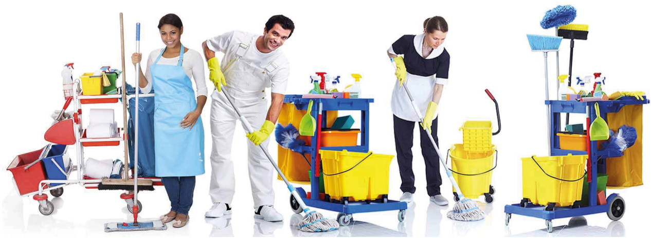
Personas con productos de limpieza.

Si mientras estás trabajando tienes algún accidente acude de inmediato a tu supervisor o supervisora para que te ayude.