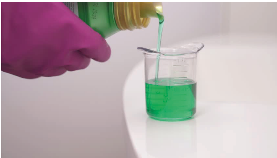
Tapón con producto de limpieza.

*Dosificación. Utilizar la cantidad correcta de un producto. La medida correcta suele ser el tapón del producto.