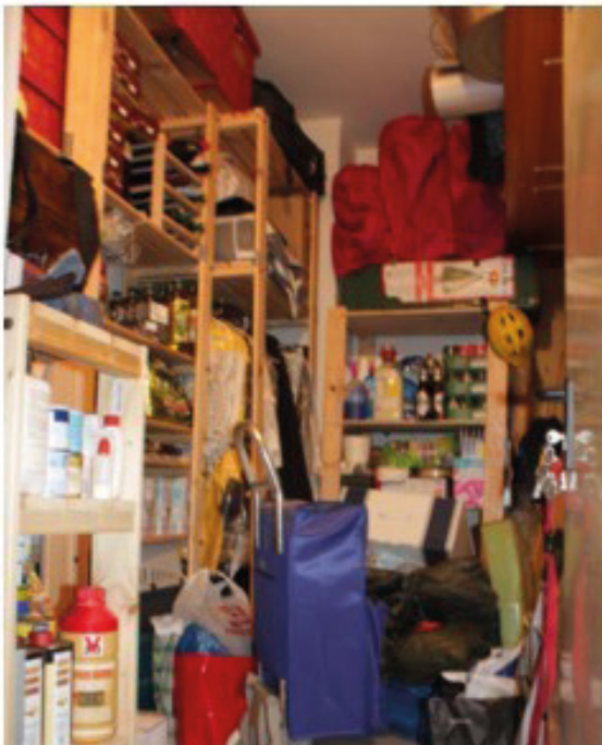
Cuarto de limpieza desordenado.