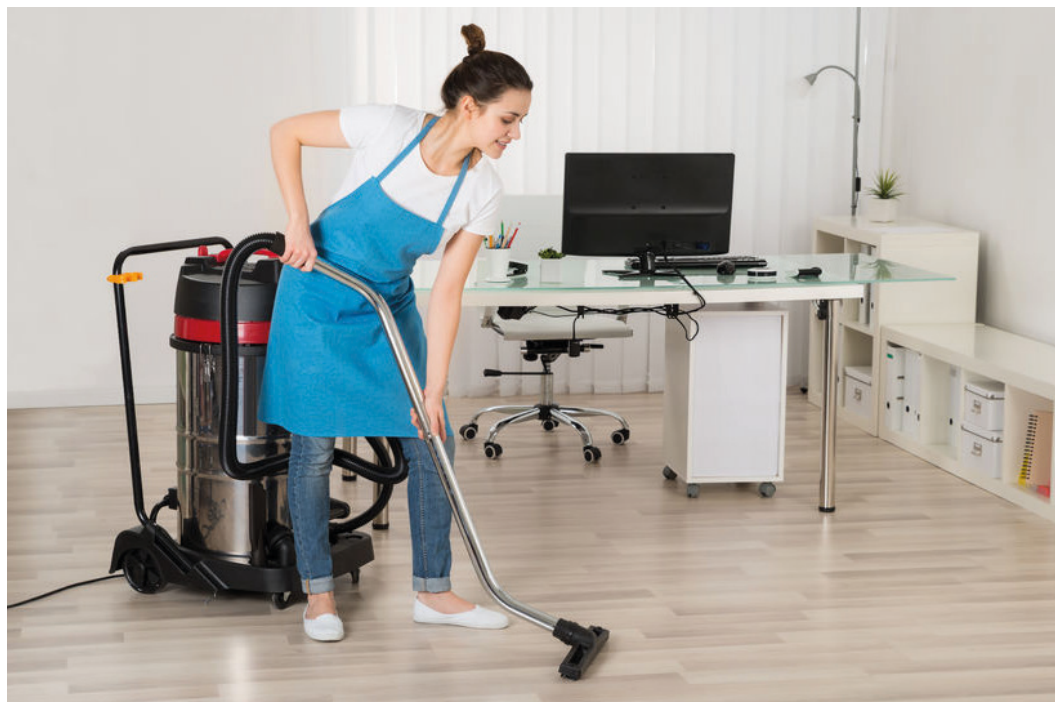
Persona limpiando la oficina con una maquina aspiradora.